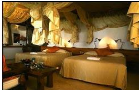
Ausruhen in gemütlichen Betten