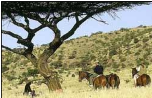
Reiten in der Steppe