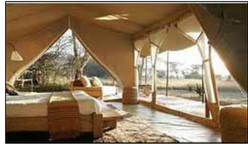
Ausblick aus dem Zelt