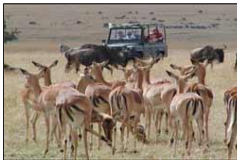
Wild in der Steppe